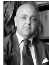
I. La Candia

Pirola Pennuto Zei & Associati studio di consulenza tributaria e legale