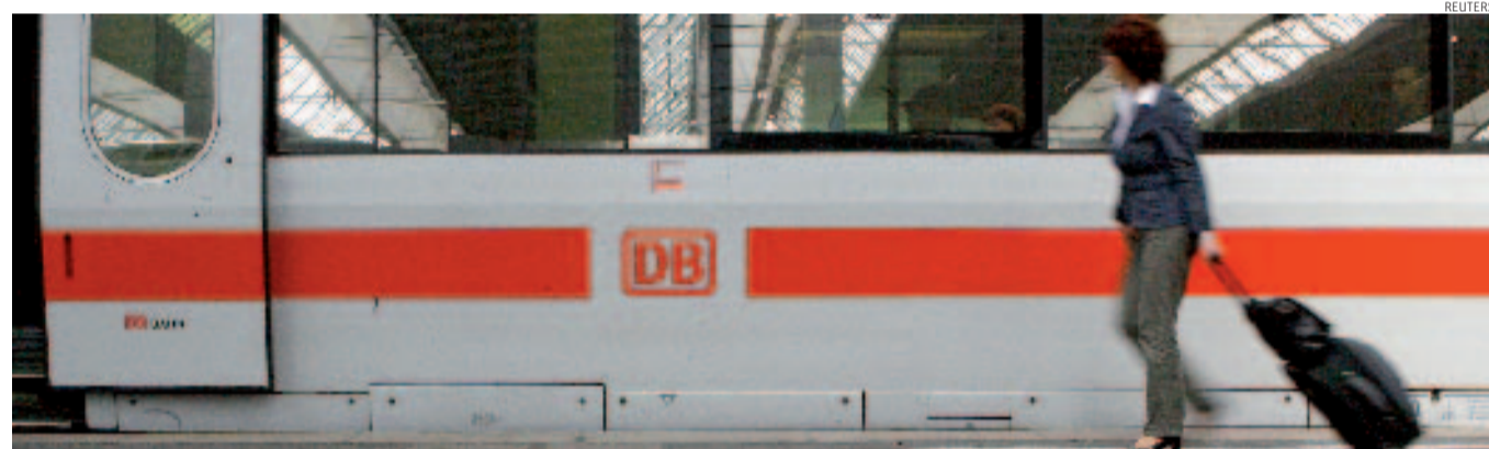
Dimensione internazionale. Tra il 2002 e il 2006 Deutsche Bahn è diventata un protagonista mondiale della logistica presente in 150 Paesi